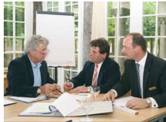
(links): Überprüfung der Lichtstärke im Tagungsraum