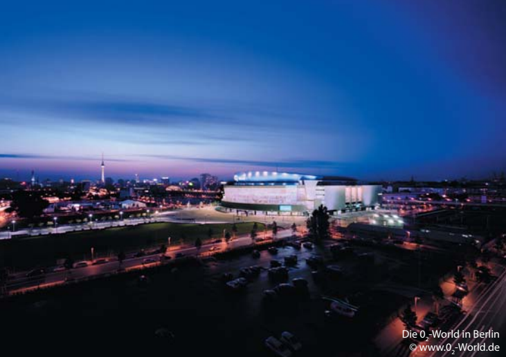
Die 0-World in Berlin