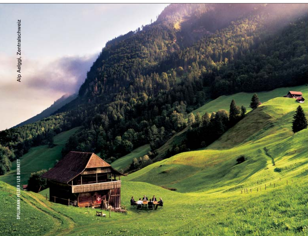
Alp Aelggi, Zentralschweiz