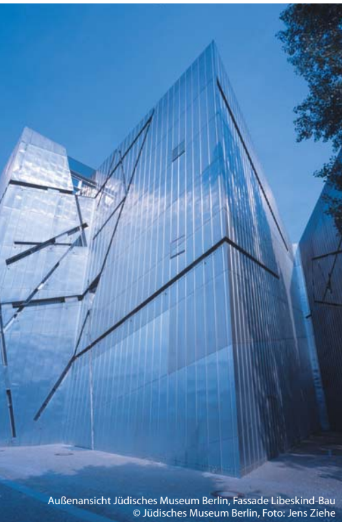
Außenansicht Jüdisches Museum Berlin, Fassade Libeskind-Bau