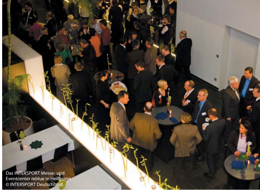
Das INTERSPORT Messe- und Eventcenter reblue in Heilbronn

Bei der Internetrecherche nach „Eventlocations“ verliert der Tagungsplaner leicht den Überblick. Geradezu inflationär hat sich der Begriff in der Tagungswelt ausgebreitet. Hatte man vor einigen Jahren noch eine einigermaßen klare Vorstellung von einer Eventlocation – die Zeche im Ruhrgebiet oder das Restaurant auf der Zugspitze –, gewinnt man heute bei der Googlerecherche den Eindruck, jede beleuchtete Scheune wird flugs zur Eventlocation umgewidmet und angepriesen. Aber auch die Grenzen zwischen „klassischer“ Tagungsstätte und Eventlocation lösen sich auf – so manche brave Stadthalle geriert sich als Eventlocation, in der Hoffnung, mit der neuen Klassifikation die Kundschaft ins Haus zu locken. Aber es gibt sie, die Eventlocations – „Ereignisorte“, in denen sich außergewöhnlich tagen und erleben lässt.