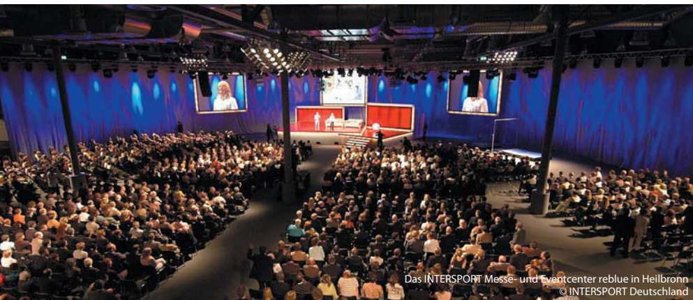
Das INTERSPORT Messe- und Eventcenter reblue in Heilbronn

ner Tagungstechnik, können hier Events von 250 bis 500 Personen durchgeführt werden. Die Spielbank selbst hat vier Bars und eine erstklassige Küche. Täglich besuchen etwa 2.000 Gäste dieses kleine Las Vegas direkt am Potsdamer Platz.