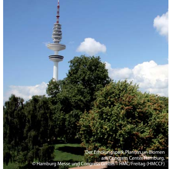
Der Erholungspark „Planten un Blomen“ am Congress Center Hamburg.

In puncto Tagungsqualität ist Deutschland führend. Nirgendwo in Europa ist das Qualitätsniveau von Tagungsstätten und -dienstleistern so hoch wie hier. Das macht Deutschland als Tagungsdestination