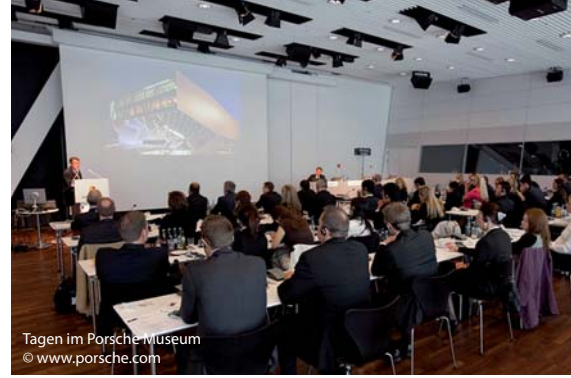
Tagen im Porsche-Museum

Auch als Messe, Kongress und Tagungsstandort gehört Stuttgart zur Elite. Die jährlich vom Europäischen Verband der Veranstaltungs-Centren e.V., der Deutschen Zentrale für Tourismus e.V. und des GCB German Convention Bureau e.V. in Auftrag gegebene Studie Meeting- & EventBarometer unterstreicht dies. Stuttgart ist unter den Top 10 der attraktivsten Tagungs- und Kongressregionen in Deutschland. Ausschlaggebend für die Wahl waren das ausgezeichnete und breit gefächerte Angebot an Tagungs- und Kongresshäusern, die attraktiven Rahmenprogramme sowie die optimale Verkehrsanbindung.