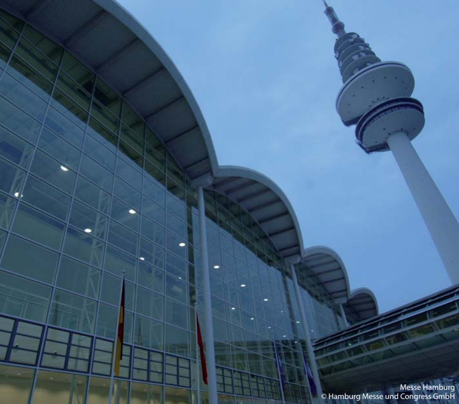
Messe Hamburg