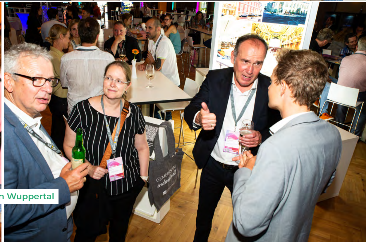
Impressionen vom 19. Deutschen Verbändekongress 2024 in Wuppertal