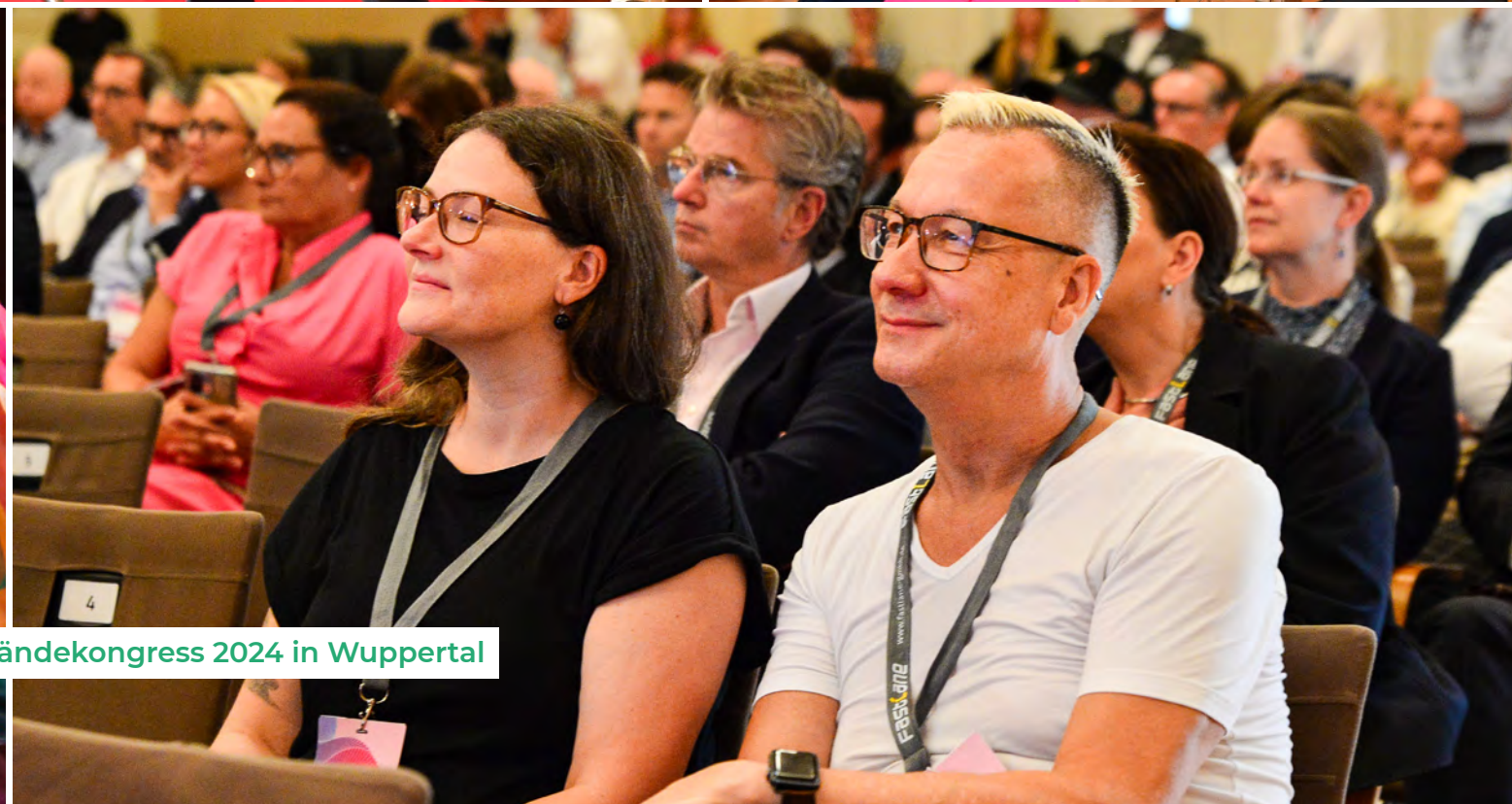
Impressionen vom 19. Deutschen Verbände-kongress 2024 in Wuppertal

26. August 2026 10.00 – 18.00 Uhr mit anschließender Abendveranstaltung „Rhein-Lounge“