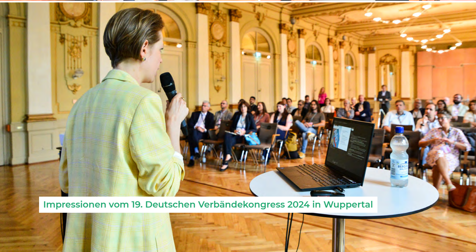
Impressionen vom 19. Deutschen Verbände-kongress 2024 in Wuppertal