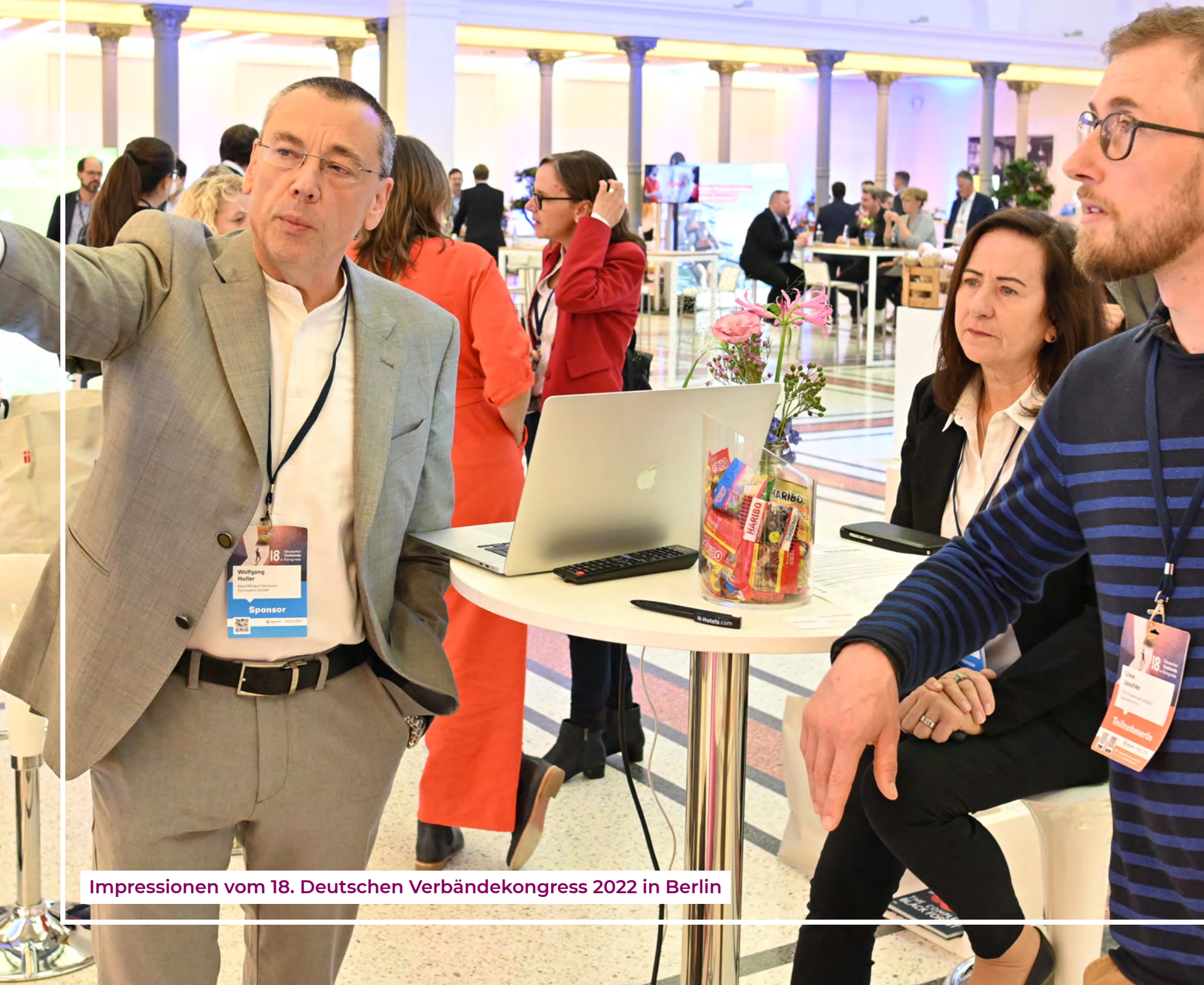
Impressionen vom 18. Deutschen Verbändekongress 2022 in Berlin