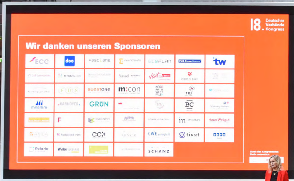
Impressionen vom 18. Deutschen Verbändekongress 2022 in Berlin

Die Abendveranstaltung zur Preisverleihung des DGVM INNOVATION AWARD „Verband des Jahres“ findet im Anschluss an den ersten Kongresstag im Ausstellungsbereich statt.